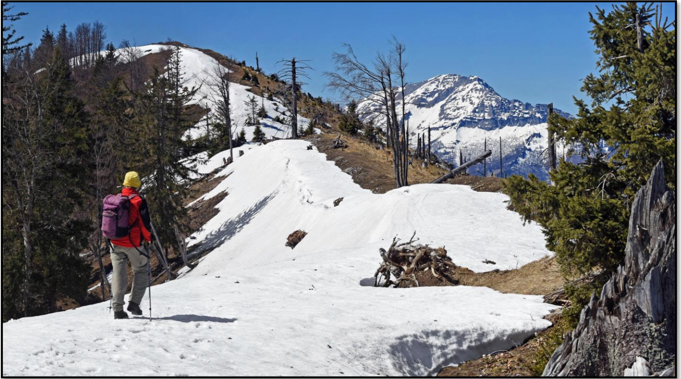
Anstieg auf den Gr. Sulzberg 1400m im Frühling