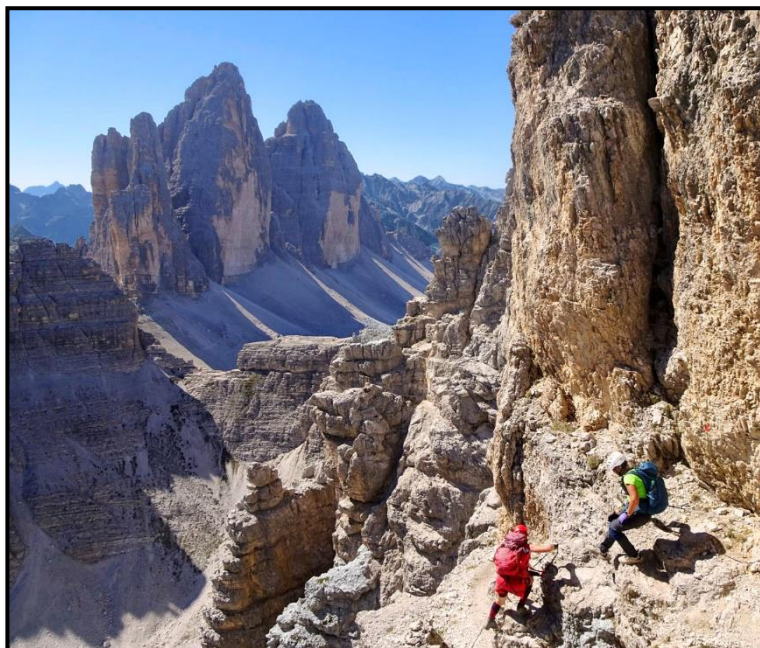
In den Dolomiten