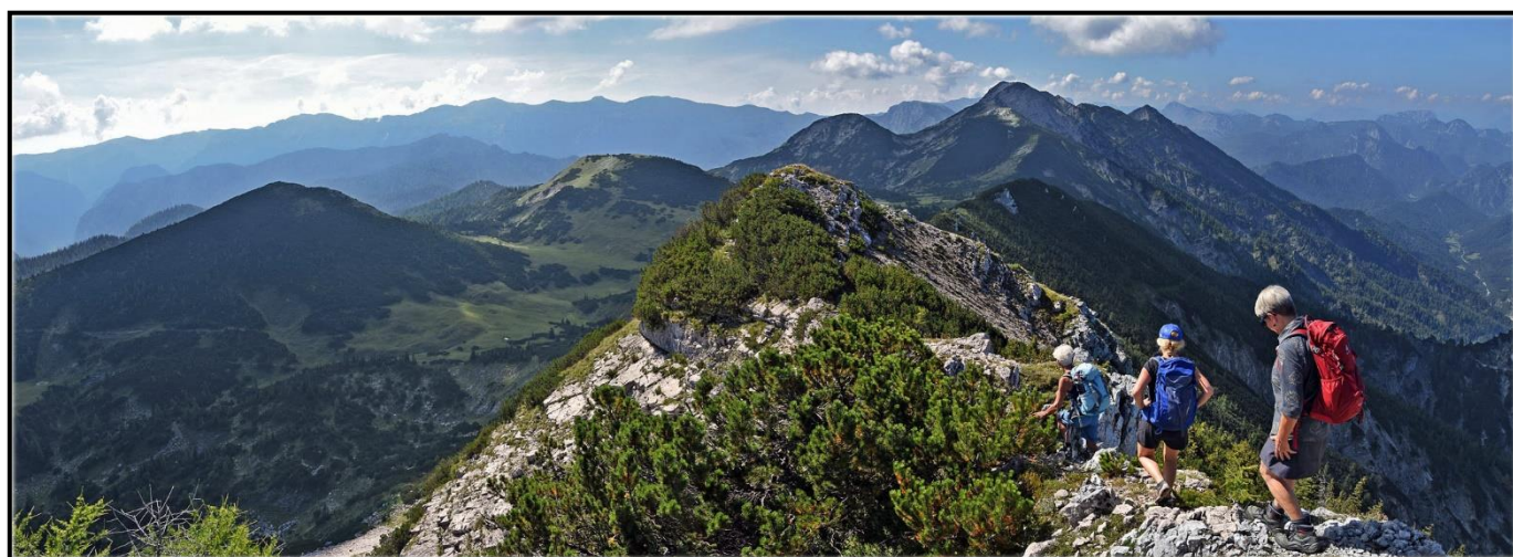
Über den Fadenkamp 1804m, auf den Hochstadl 1919m

Anmeldung und Auskunft bei Reinhard Zenz , Tel. 0664 / 8150272