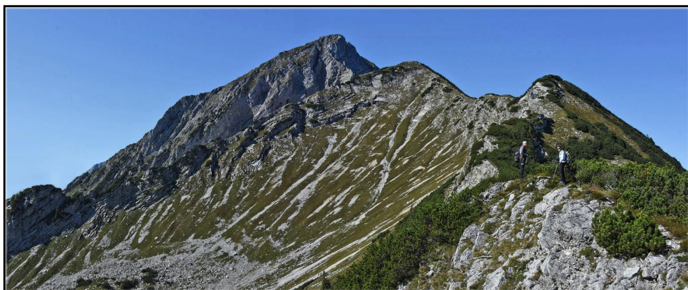
Aufstieg vom Buttensattel auf den Tamischbachturm 2035m