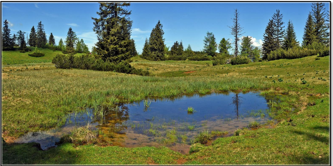
Auf dem Weg zum Buchberg 1563m im Hochschwabgebiet

Bei Touren mit dem PKW ist meistens genügend Platz für Mitfahrer vorhanden PKW Fahrer bitte rechtzeitig anmelden damit der Organisator der Tour weiß wieviele Plätze zur Verfügung stehen !