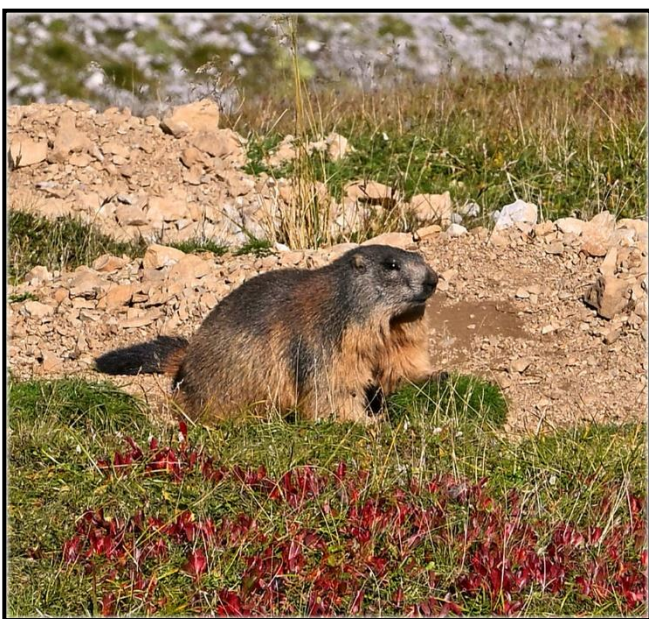
Murmeltier im Hochschwabgebiet

Das Sommerprogramm kommt zur Verteilung ! Gäste sind immer herzlich willkommen !